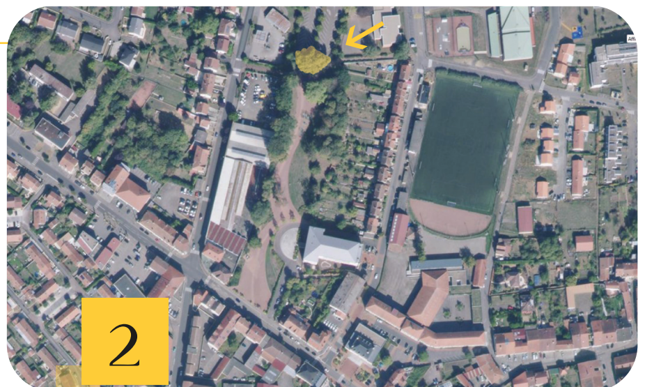
Photo 2 - 2018, vue satellite du Square Toussaint