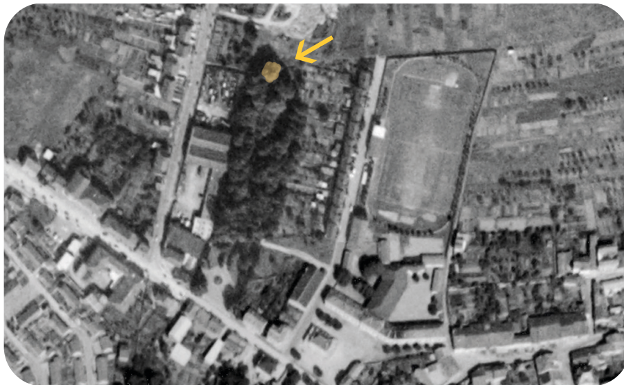
Photo 1 - 1950, vue satellite du Square Toussaint

A l'aide des photographies une et deux, nous pouvons voir l'évolution du Square Toussaint entre 1950 et 2018.